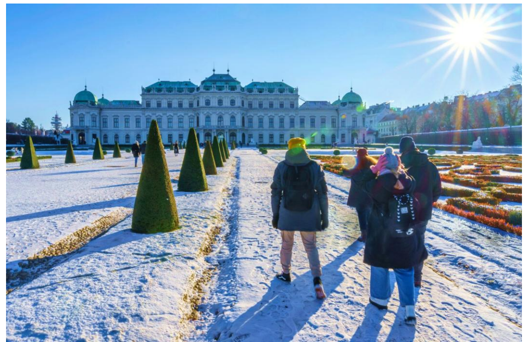
Visiter le château de Schönbrunn