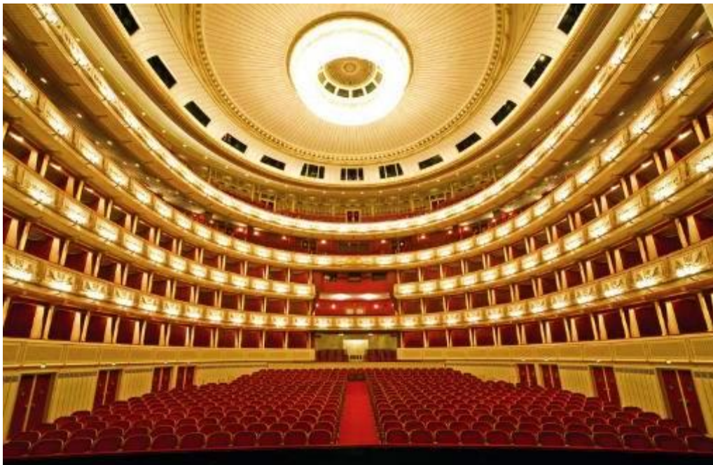
Vivre l'incroyable expérience d'une soirée à l'opéra !