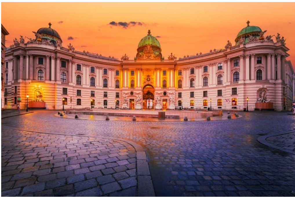
Le palais de la Hofburg, symbole de la culture et du patrimoine