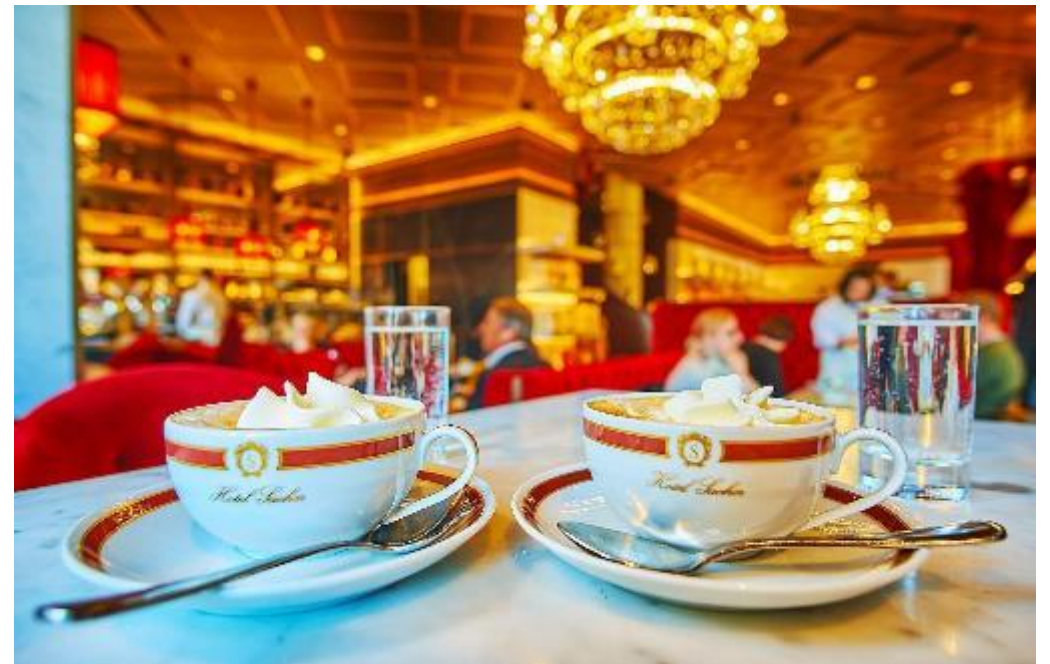
Goûter à l'atmosphère feutrée des cafés de Vienne